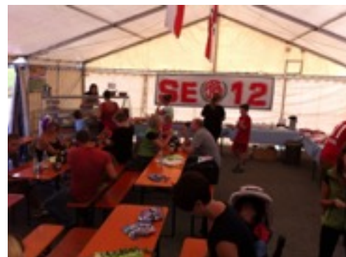
(Die Tombola sowie Kaffee- u. Kuchenstation)