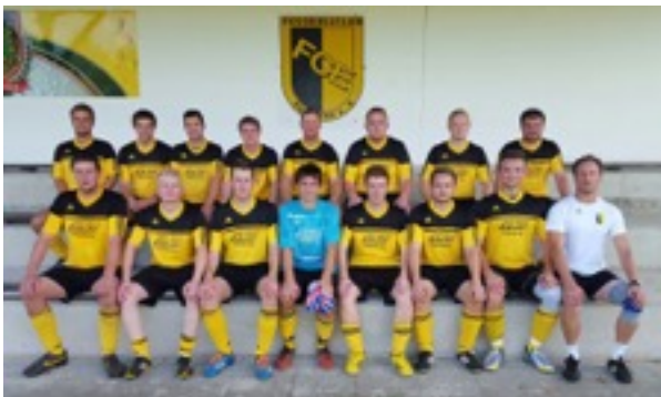
(Tabelle 1. Mannschaft)